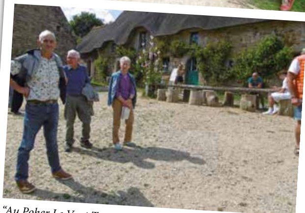
"Au Poher Le Vent Tourne : l'association de sortie au beau village de Poul-Fetan".