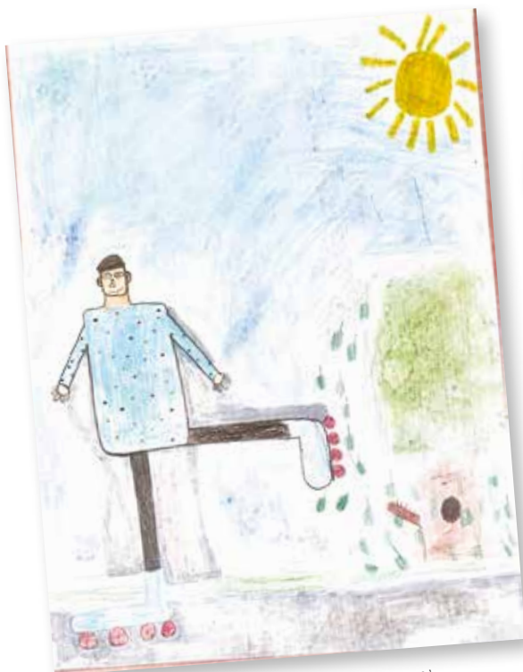
3 ème ex aequo Aymeric PASQUET