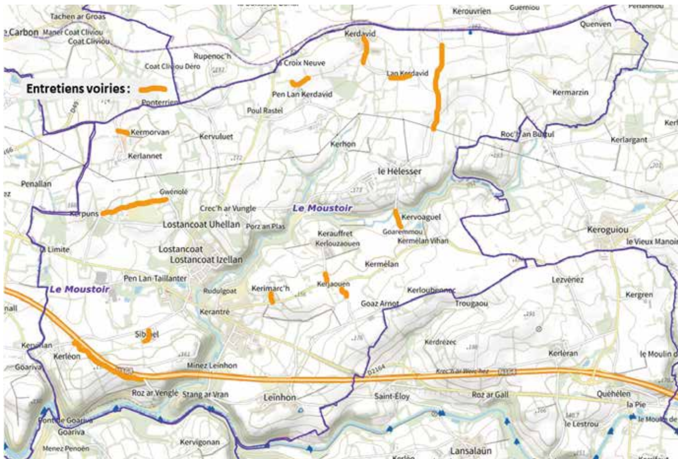
L'élagage se fera en mars 2024 en tenant compte des priorités.