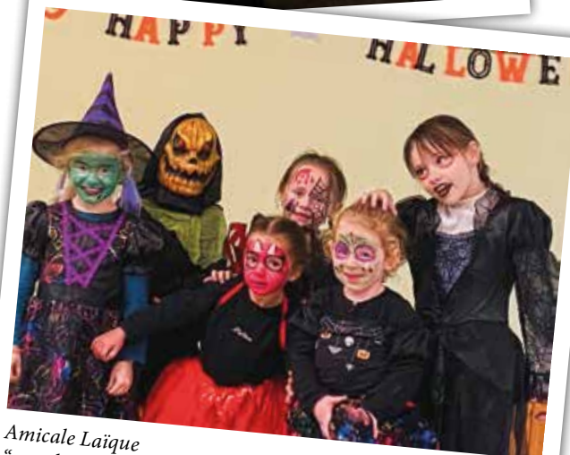
Amicale Laïque "...un bonbon ou un sort ! Le choix est vite fait..."