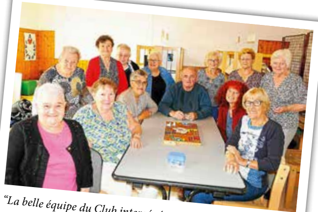
"La belle équipe du Club intergénérationnel"