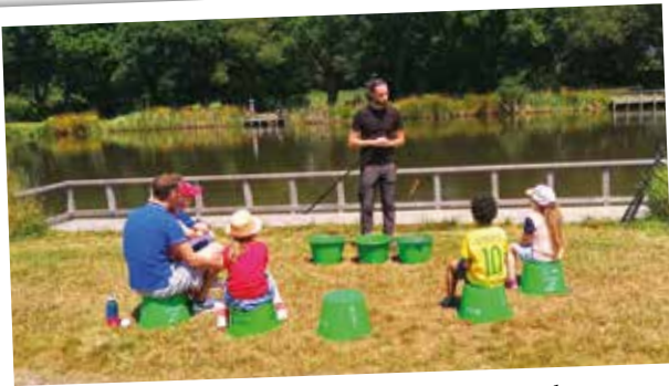
Association agréée de pêche et de protection des milieux aquatiques : AAPMA. "Il y a de quoi faire !"

Nos associations vous transmettent quelques photos de l'année.