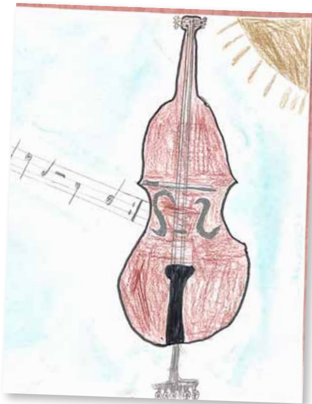
1 er Ewen COX