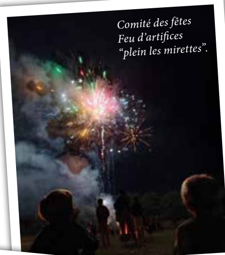
Comité des fêtes Feu d'artifices "plein les mirettes".