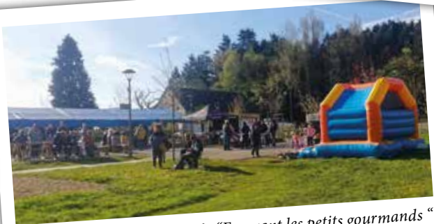
Chasse à l'oeuf - "En avant les petits gourmands"