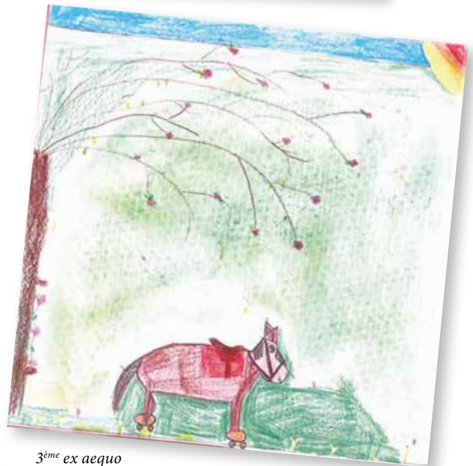
3 ème ex aequo Jade Le BOURHIS