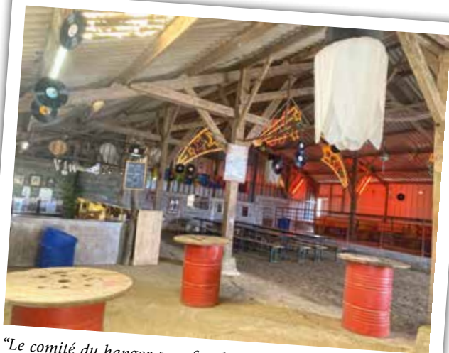
"Le comité du hangar peaufine la déco avant de lancer les festivités".