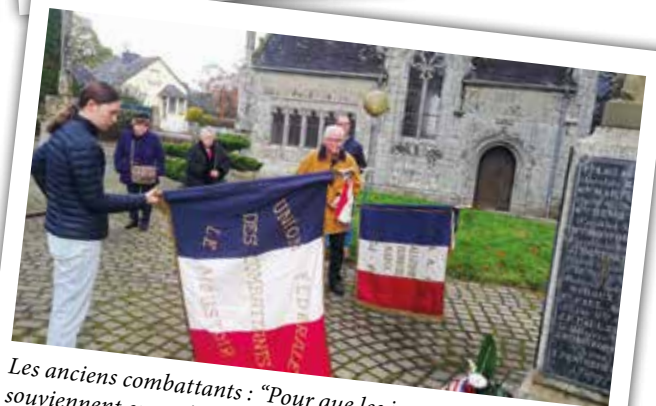
Les anciens combattants : "Pour que les jeunes générations se souviennent encore".